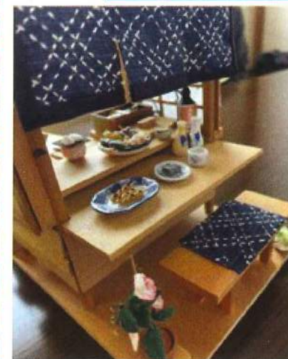
ドールハウス おでん屋台