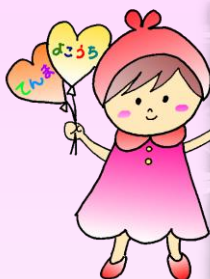
医療・介護の 多職種連携会議