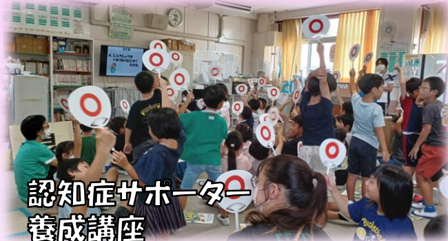
認知症サポーター 養成講座