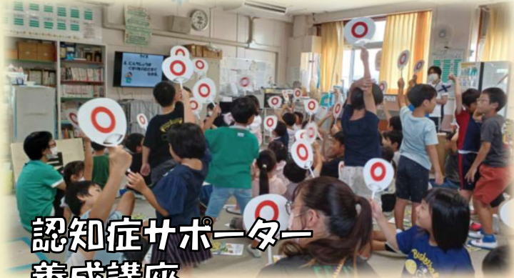
認知症サポーター 養成講座